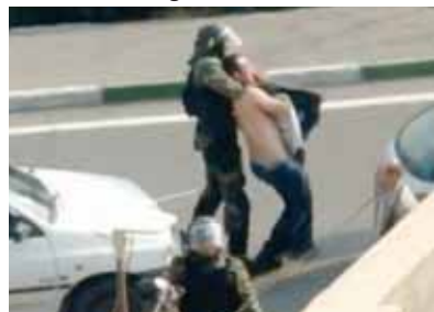
Amateurvideo zeigt brutales Schlagen von Demonstranten

Die Ansammlung von Geheimdienst, Militär, Bassij und Agenten in Zivil stand keinen Meter entfernt den Demonstranten gegenüber. Sie waren in den Straßen rund um den Azadi Platz verteilt bis hin zur Enghelab Straße und dem Arya Shahr Bezirk. Ca. 500 Demonstranten, viele davon Frauen und junge Frauen, wurden am Arya Shahr und an anliegenden Gebieten verhaftet.