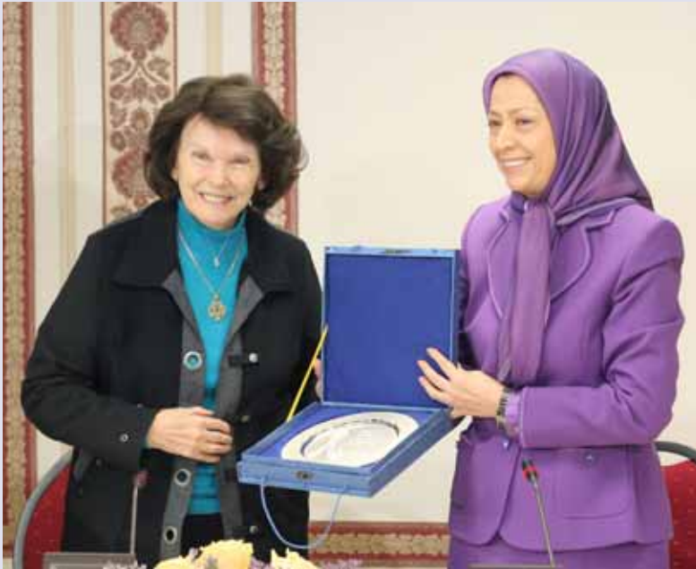
Auvers-sur-Oise, Frankreich, 2. Februar 2010 – Frau Rajavi übergibt ein Geschenk, das Ashraf symbolisiert, an Frau Mitterrand