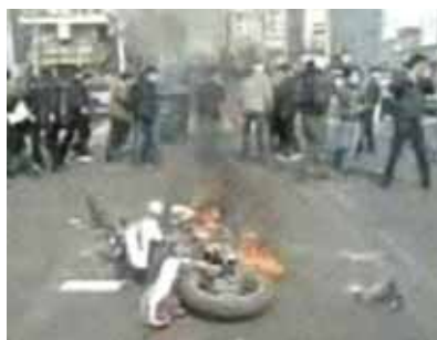
Motorrad der Bassij am Teheraner Mossaddeq Platz in Brand gesteckt

Es gab Zusammenstöße zwischen Spezialeinheiten und Demonstranten in verschiedenen Stadtteilen Teherans. Die paramilitärische Bassij, mit Messern bewaffnete Personen, Hooligans und andere Verbrecher benutzten Messer und Schaufeln, um Menschen anzugreifen, die Anti – Regime Slogans riefen. Es gab auch Zusammenstöße zwischen Jugendlichen und den staatlichen Sicherheitskräften (SSF).