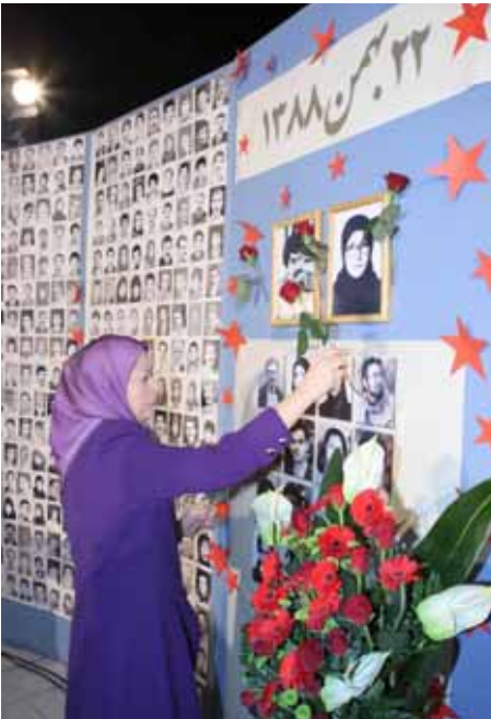
Frau Rajavi gedenkt der Gefallenen der Aufstände

Am Donnerstag, dem 11. Februar trafen sich am Abend viele in Frankreich lebenden Iraner in der Residenz von Maryam Rajavi, der vom iranischen Widerstand gewählten Präsidentin in Auvers-sur-Ois, um den Jahrestag der antimonarchistischen iranischen Revolution 1979 zu gedenken. Frau Rajavi äußerte bei