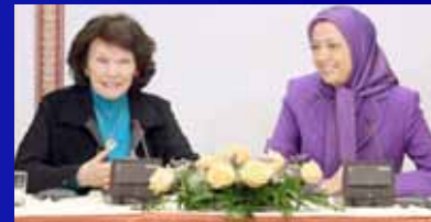
Danielle Mitterrand besucht Maryam Rajavi