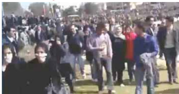
Große Menge versammelt sich am Ufer in der Nähe der historischen Isfahan Siyo-se pol (Siyo-se Brücke)

In Isfahan gab es an vielen Ort am 11. Februar heftige Zusammenstöße Die Menschen riefen „Nieder mit dem Diktator“ und „Nieder mit Khamenei“. Viele Menschen wurden verhaftet. In der südiranischen Stadt Shiraz gab es schwere Zusammenstöße mit Demonstranten und Scharmützel in der ganzen Stadt. Viele Demonstranten wurden verhaftet. In Yazd, Zentraliran, versammelte sich eine große Gruppe von Demonstranten am Atlassi Platz und rief „Nieder mit dem Diktator“ und „Nieder mit Khamenei“. Sie wurden brutal von den unterdrückenden Einheiten angegriffen. In Masshad, Nordostiran, wurden ca. 100 Menschen verhaftet, nachdem unterdrückende Einheiten die Demonstranten angriffen. In Gonbad Kavous, Nordiran, rissen Menschen die Portraits von Khamenei und Ahmadinejad herunter und frifen Anti – Regime Sprechchöre.