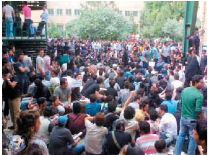
Freie Universität Teheran, 27. Oktober 2009

Mehr als 70 Studenten begannen den Protest, und die Menge der Demonstranten wuchs sofort an. Als Bewohner der umgebenden