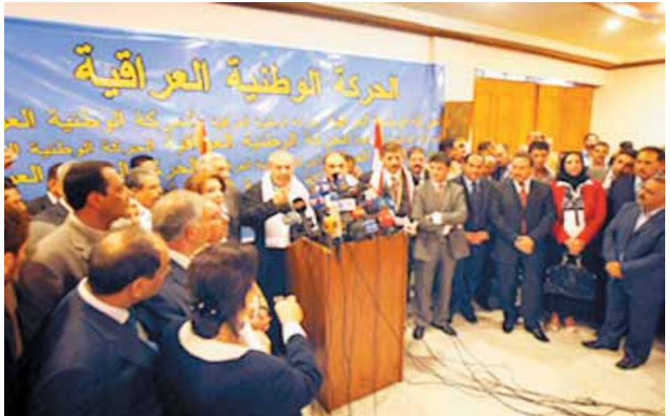
Die neue irakische Nationalbewegung will das Sektierertum im Irak beenden

Die Wahl im Irak ist für den 16. Januar angesetzt, doch es gibt wachsende Besorgnis darüber, dass die Wahl aufgrund der Verzögerungen zur Verabschiedung eines reformierten Wahlgesetzes verschoben werden könnte