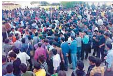
Studenten der Yasuj Universität 26. Oktober 2009

Die Behörden der Universität führten in der letzten Woche nach Geschlechtern getrennte Busse ein, doch die Studenten protestieren gegen diese Neuerung des Regimes.