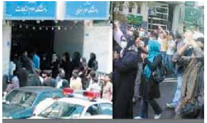
Unterstützung für die Allameh Studenten – 25. Oktober 2009

Häuser die rufenden Studenten hörten, schlossen sie sich der Demonstration an und riefen mit ihnen regime-kritische Parolen.