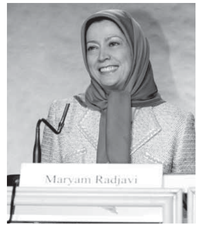
MARYAM RADJAVI Présidente élue de la Résistance iranienne

En ce qui nous concerne, nous ne céderons pas un iota de nos droits. Nous sommes convaincus que nous surmonterons toutes les difficultés. Nous gagnerons,