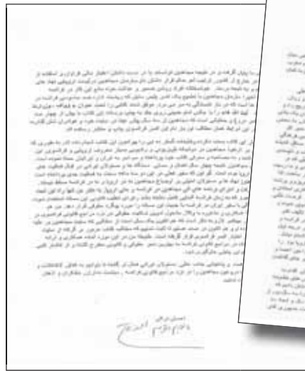
Lettre à Ahmadinejad

Le jugement note dans ses attendus que l'intéressé a reconnu à l'audience l'envoi de ce courrier, ce qui “montre la proximité de la partie civile avec le pouvoir actuel et sa volonté de discréditer les Moudjahidine”.