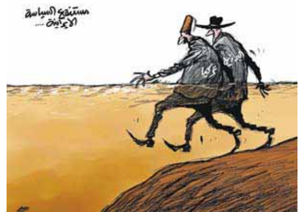
Le Brésil et la Turquie "dans le marécage de la politique iranienne".

négociations ni la complaisance ne leur feront abandonner leur projet. Alors que la dictature religieuse parle d'envoyer une partie de son uranium enrichi à 3,5% en Turquie, des milliers de centrifugeuses tournent à Natanz en violant ouvertement les résolutions du Conseil de sécurité. La Résistance déplore le rôle joué par le Brésil et la Turquie pour sortir de la crise les bourreaux du peuple iranien ; un peuple qui veut un changement de régime, la démocratie, ainsi que la paix et la stabilité dans la région. Aucune manœuvre politique ni aucun soutien étranger ne pourront empêcher ce régime d'être renversé.