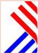
Nouveaux Droits de l'Homme

Les Nouveaux Droits de l'Homme, ont déclaré dans un communiqué le 20 mai :