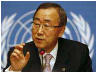
Ban Ki-moon, Secrétaire général de l'ONU

Le Secrétaire général de l'ONU a présenté un rapport sur les mois de mars, avril et mai 2010 a présenté un rapport au Conseil de sécurité sur le respect des responsabilités de la Mission d'assistance des Nations Unies pour l'Irak (MANUI). Le rapport souligne à propos d'Achraf: