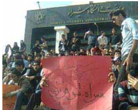
Université de Chiraz

Selon le règlement de l'Université de Chiraz, rire, parler et plaisanter à voix haute sur le campus de l'université est interdit. C'est la première fois que ce règlement est mis en place au niveau universitaire dans le pays. Il comporte sept chapitres et 23 articles et a déjà été distribué aux étudiants. Au nombre de ces règles figurent les articles suivants :